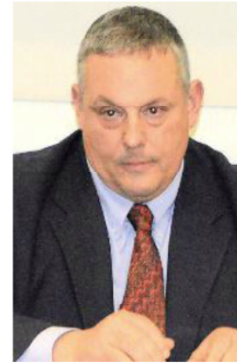
GROSSETO Vivarelli Colonna