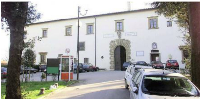
L'ospedale 'Serristori' a Figline, da anni al centro di un progetto di ridimensionamento e ristrutturazione